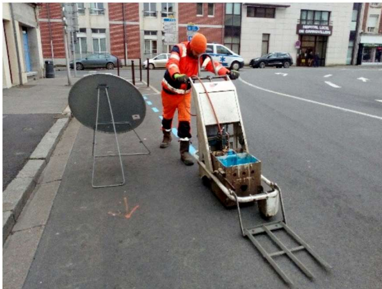
Le marquage au sol de la zone bleue a commencé ce mercredi 18 janvier 2019 rue du Général Leclerc à Grandvilliers.

La zone bleue est progressivement mise en place à Grandvilliers (Oise) . Ce mercredi 16 janvier 2019, le marquage au sol a été effectué rue du Général Leclerc. Il sera achevé avec la pose d'une signalétique vendredi 18 janvier 2019 dans les rues concernées.